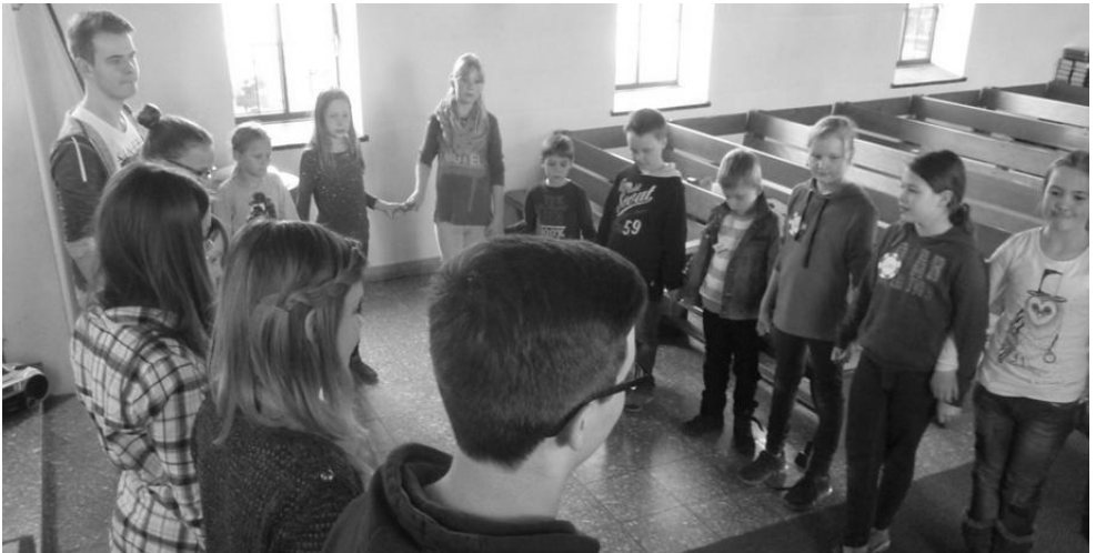
Abschlusskreis in der Kapelle

Nachdem die Kinder in der Kapelle ein Namensschild ausgesucht hatten mit einem Schiff, einem Rettungsring oder einem Wal drauf, wurde die Geschichte von Jona und dem Wal vorgelesen. Anschließend ging es in die Kleingruppen. Alle Kinder bekamen die Geschichte und durften sich ihr eigenes Buch binden und es anmalen. Gebastelt wurden auch wunderschöne Aquarien aus Papptellern in denen Jona, der Wal und eine tolle Unterwasserwelt zu sehen waren.