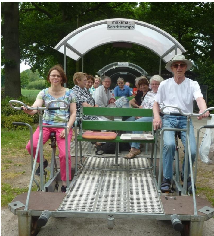
Der Gemeindegemeinderat auf Draisinenausflug in Westerstedde