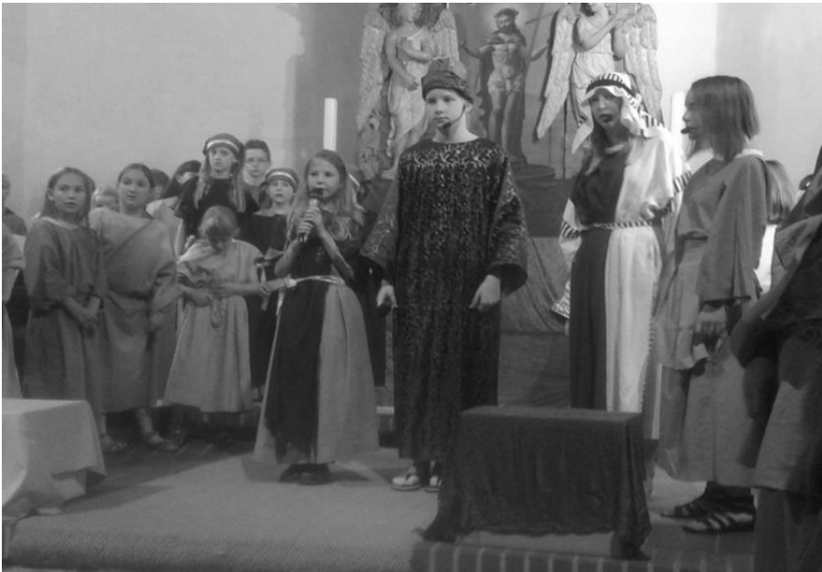
Aufführung des Kindermusicals „Ich will das Morgenrot wecken“.